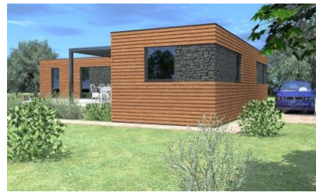
Modulový dům "DOUBLE BETA " 12x4 + 12x4 m do tvaru " L " ( celková zastavěná plocha 96 m2 )

cena včetně dopravy a usazení 1 710 000,- Kč bez DPH cena včetně dopravy a usazení 1 969 500,- Kč s 15% DPH