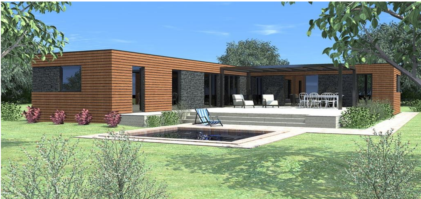
Modulový dům "DOUBLE BETA " 12 x 4 m do tvaru " L "

cena včetně dopravy a usazení 1 710 000,- Kč bez DPH cena včetně dopravy a usazení 1 969 500,- Kč s 15% DPH