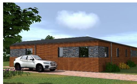
Modulový dům "DOUBLE ALFA" 12x4 + 12x4 m do tvaru " L " ( celková zastavěná plocha 96 m2 )

cena 1 997 552,- Kč bez DPH cena 2 297 185,- Kč s 15% DPH